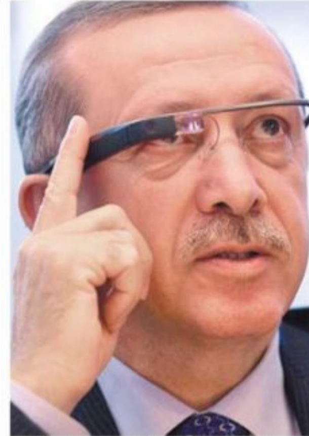
ABD'de Silikon Vadisi'ni ziyaret eden Erdoğan "Google Glass" isimli teknolojik gözlüğü ve sürücüsüz otomobili test etti.

» POLİS Hatay'da Reyhanlı saldırısının faillerini ararken uyuşturucu trafiğiyle karşılaştı. Kilosu 300 bin dolardan satılan 22 kilo metamfetamin ele geçti. 4'ü İranlı 9 kişi gözaltında. »12