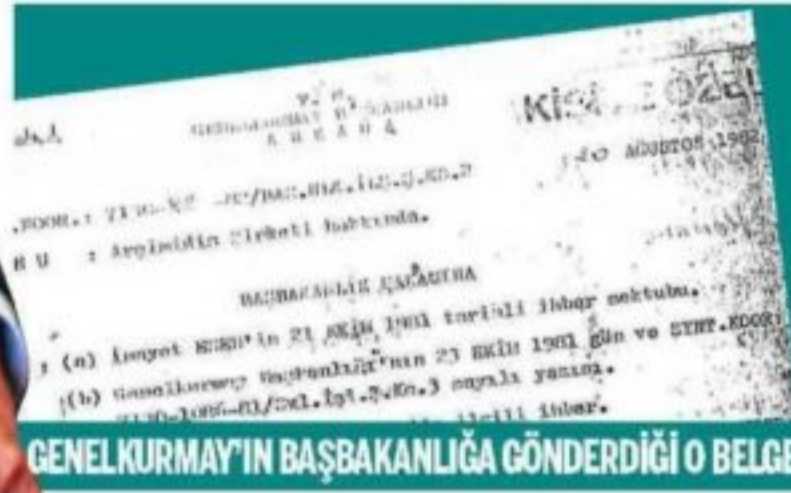
GENELKURMAY'IN BAŞKANLIĞA GÖNDERDİĞİ O BELGE