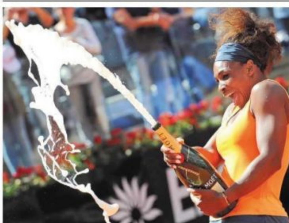
ZAFER SERENA WILLIAMS'IN İtalya Açık Tenis Turnuvası Finali'nde bir numara Serena Williams, Victoria Azarenka'yı 2-0 yenerek on yıl aradan sonra İtalya Açık'ta şampiyon oldu. »19