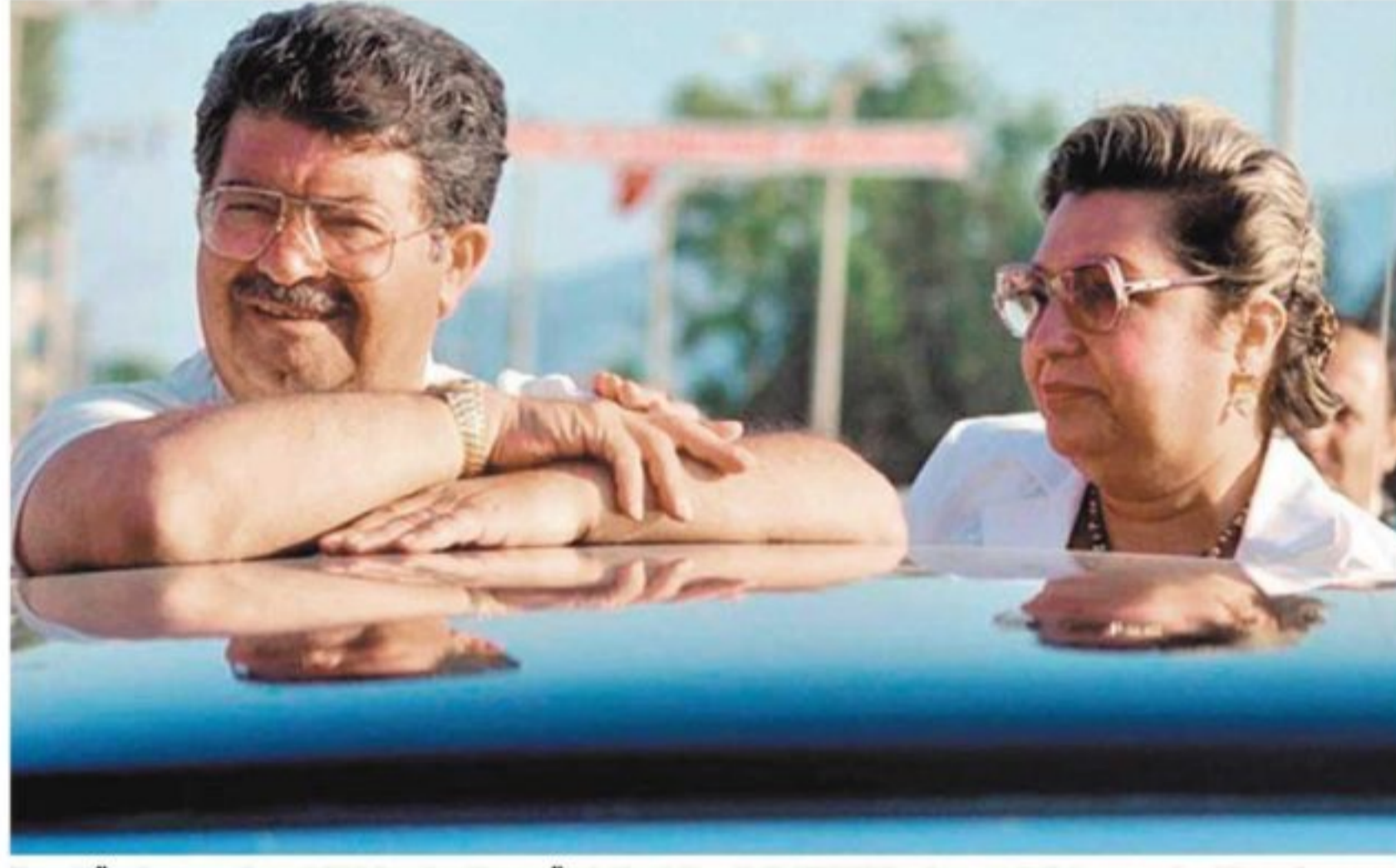
Turgut Özal'ın en yakınındaki isim olan Semra Özal, Demirören'le ilgili iddiaları içeren gizli dosyayı almakla suçlanıyor.